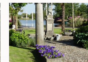
De tuin in bloei