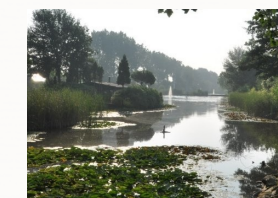
Vijver van Landgoed de Zuilen