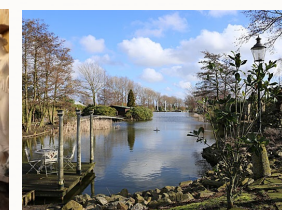
Foto genomen langs de wandel route van de Zuilen