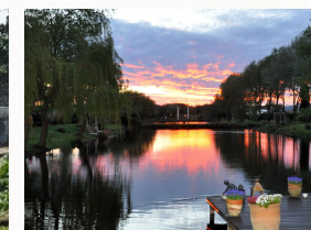
Zonsondergang genomen vanaf het 'Eilandje'