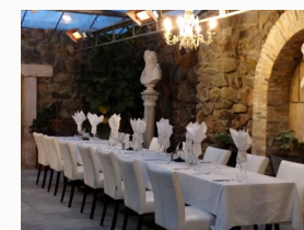
Kleine zaal van Landgoed de Zuilen