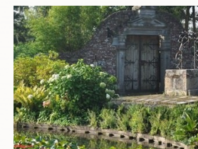
De tuin van Landgoed de Zuilen

Mocht u eventueel nog andere aanvullingen wensen, neem dan contact op met Landgoed de Zuilen.